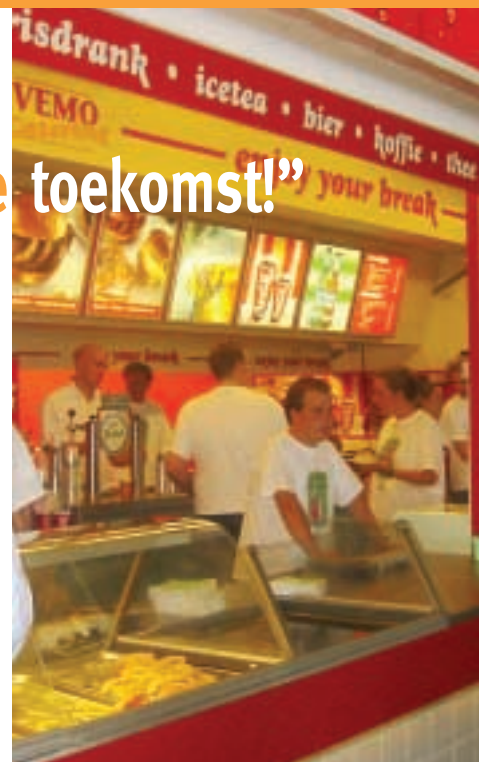
De zaak van VEMO-Catering in de Amsterdamse Arena wordt druk bezocht.