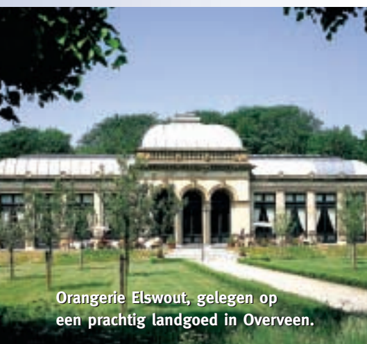
Orangerie Elswout, gelegen op een prachtig landgoed in Overveen.